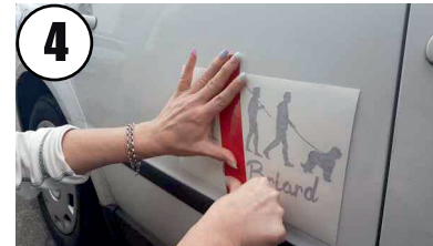
4 Aufkleber fixieren