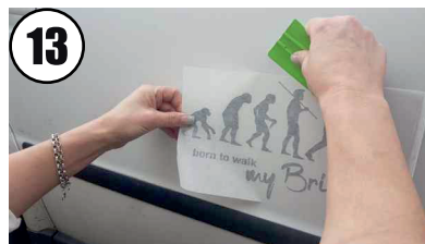
13 Nochmal aus der Mitte heraus rakeln