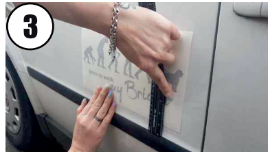
3 Abstände abmessen