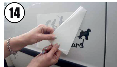
14 Übertragungsfolie vorsichtig abziehen