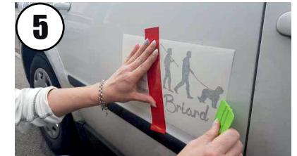
5 Motiv bitte nochmals feststrakeln!