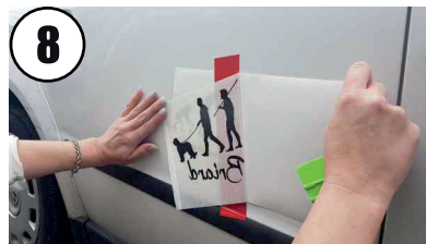
8 Trägerfolie abziehen bis zur Fixierung