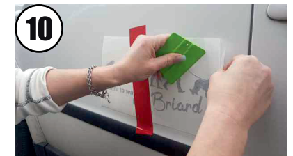
10 Feststreichen mit Rakel