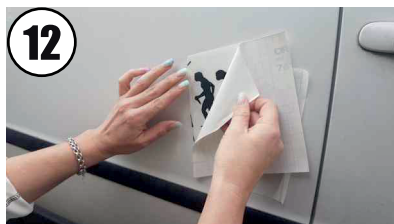
12 Trägerpapier entfernen