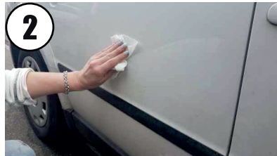
2 Klebefläche reinigen