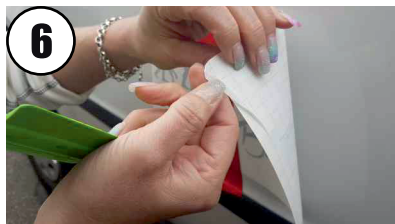
6 Transportsicherung lösen