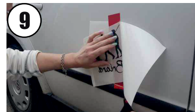
9 Trägerfolie abschneiden