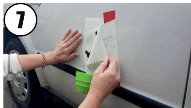
7 Übertragungsfolie rechts abziehen