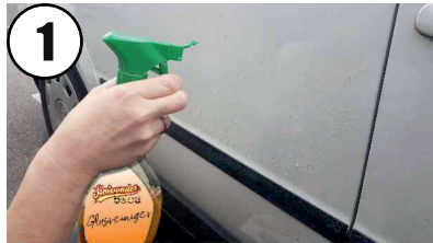
1 Reiniger aufsprühen